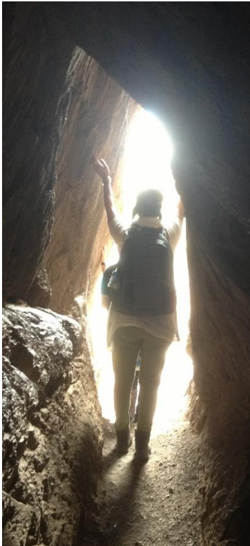
Pathway on the Way to the Temple of the Falcon, Peru 2013