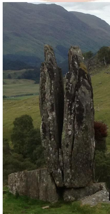
María Magdalenas bedjande händer Glenlyon, Skottland 2013